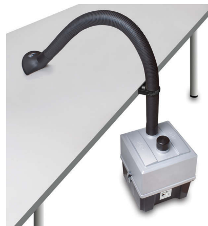
> Zero Smog EL Absauggerät